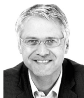
Harald Redemann Adworx, Bielefeld www.adworx.de