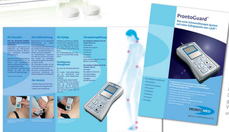
Prontomed Medizintechnik. Salesmaterialien für Produkte im neuen Corporate Design. Direktmarketing und Messegestaltungen gehören ebenso zur Vermarktung wie Handelsmarketing und Produkt PR.