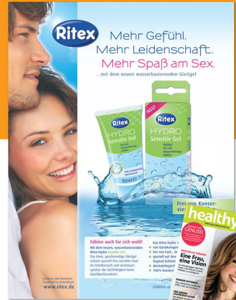
Ritex: Zielgruppengerechtes Packaging und Kommunikation aus einer Hand.