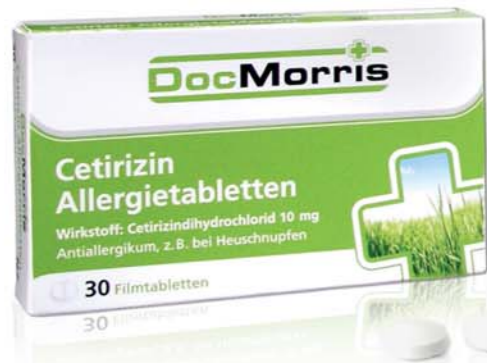
OTC Produkte Hochwertiges Brand Design unter der Dachmarke DocMorris