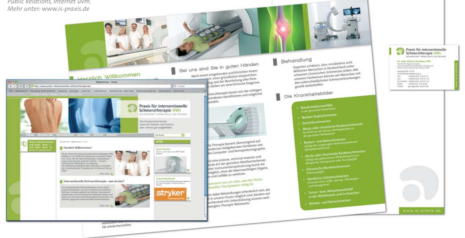
Beispiel für erfolgreiches Praxismarketing: Corporate Design, Kommunikation, Public Relations, Internet uvm. Mehr unter: www.is-praxis.de

Wollen Sie mehr über uns erfahren? Kontaktieren Sie uns – wir freuen uns über Ihre Anfrage.