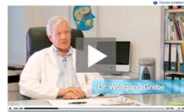
Audivisuelle Kommunikation Produkt- u. Schulungsvideos professionell im Internet oder auf CD präsentiert.