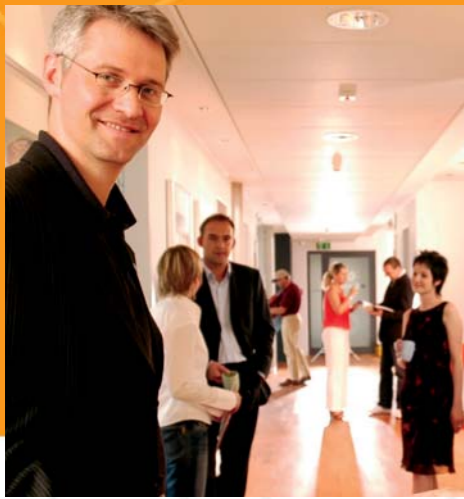
Das adworx-Team berät Sie gerne in allen Fragen rund um Marketing, Design & Kommunikation.